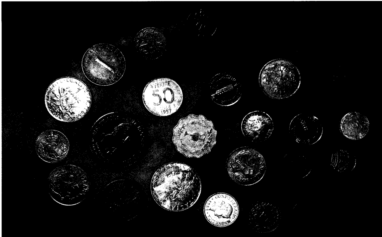
El Capítulo 2, “El trabajo de los administradores”, explica el tipo de administradores que existen en las organizaciones, los estilos administrativos y algo muy importante, el papel de la ética en la administración.

en Administración de Negocios que imparte la Escuela Superior de Comercio y Administración del Instituto Politécnico Nacional, cuyo objetivo es preparar los cuadros administrativos intermedios y superiores que son necesarios para establecer condiciones organizacionales, académicas y administrativas que permitan elevar la productividad y la búsqueda de una excelencia administrativa en el sector empresarial.